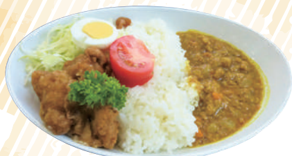
からあげダムカレー

行事食はもちろん、選択メニューも楽しみにしています! いつもおいしくて、笑顔にあふれています