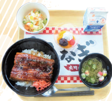
土用の丑の日 うな丼